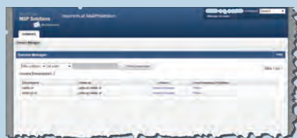
ADMIN: Domänen pflegen

Sie können Ihre Kunden und Domänen natürlich gern im Selbstservice einpflegen und warten. Darüber hinaus bieten wir jedoch kostenfrei die volle Unterstützung bei der Einbindung und laufenden Pflege. Und das nicht nur in der Startphase sondern lifetime.